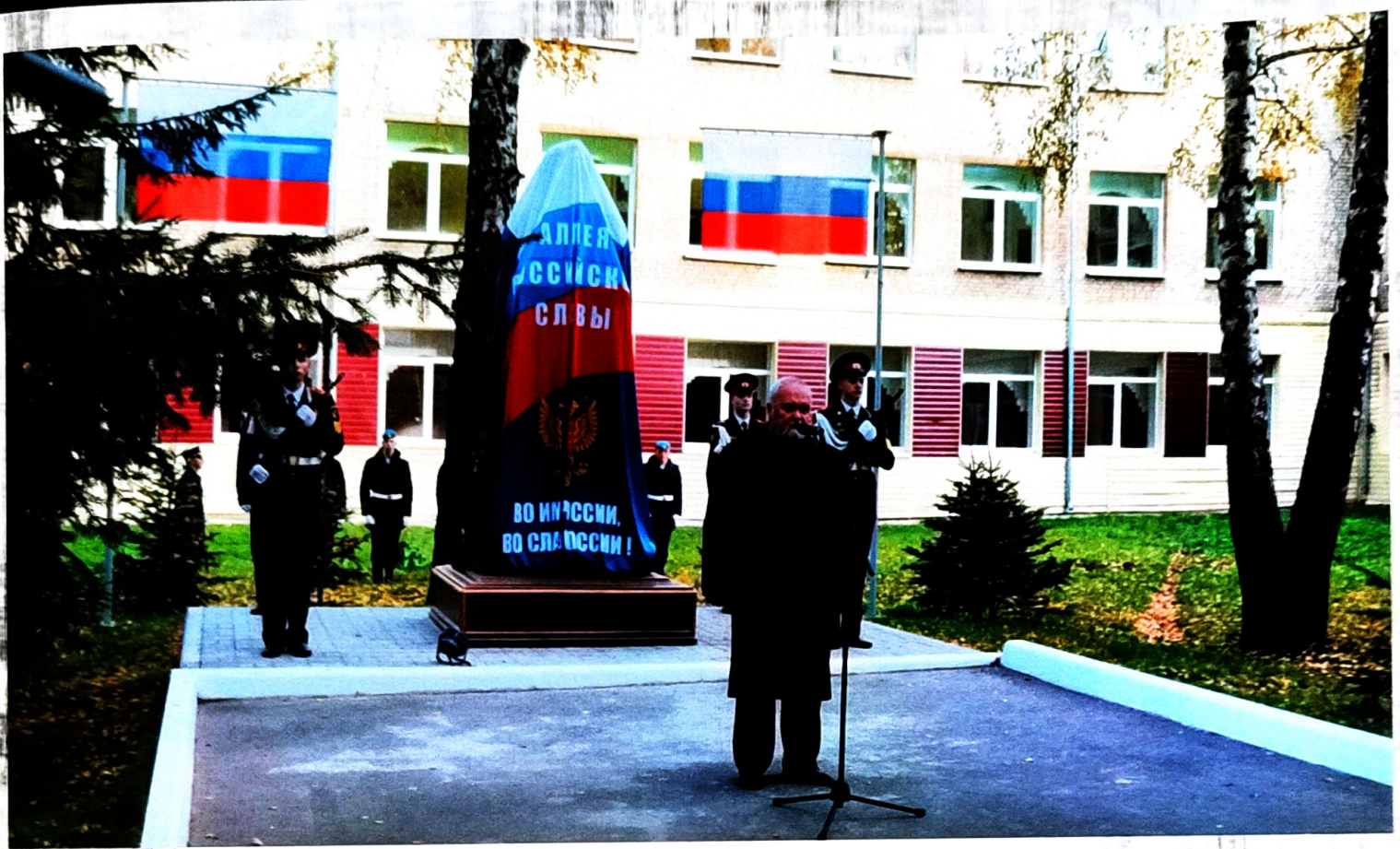
Главная крепкость нашего государства-человек. Василий Иванович Чуйков.